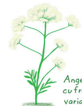
Angelica cu fructe variabile