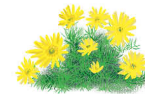
Ruscuța de primăvară