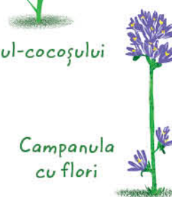
Campanula cu flori

Când te plimbi, evită să culegi plantele, căci multe dintre acestea sunt amenințate cu dispariția și protejate! De exemplu: