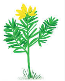
Mătura de in